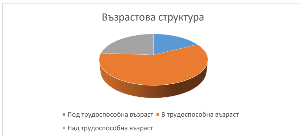
Граф. 2. Възрастова структура на населението в община Казанлък

По възрастова структура 49 247 души от населението на община Казанлък е в трудоспособна възраст като от тях 68% са жители на град Казанлък. Делът от населението под трудоспособна възраст е 17% от общото население, докато делът на населението над трудоспособна възраст е 24%.