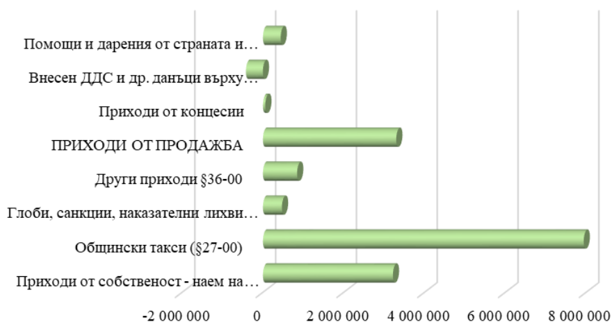
Неданъчни приходи към 31.12.2023 г.

Към края на 2023 година изпълнението на неданъчни приходната спрямо плана е 124%.